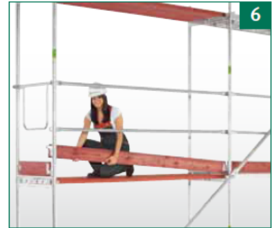
Vertikalrahmen und Beläge der nächsten Lage montieren, Diagonale, Geländer und Bordbretter einhängen.