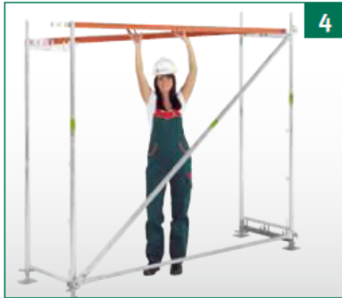
Beläge auflegen, Gerüstfeld mit Wasserwaage an Geländer und Rahmen lotrecht ausrichten.