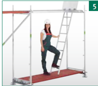
Innenliegenden Leitergang auflegen.